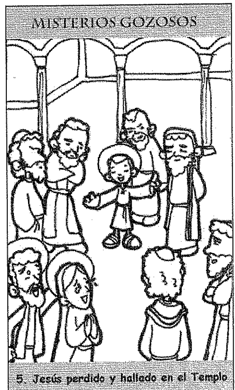
5. Jesús perdido y hallado en el Templo

DIOS TE SALVE, MARÍA, LLENA ERES DE GRACIA, EL SEÑOR ES CONTIGO, BENDITA TÚ ERES ENTRE TODAS LAS MUJERES Y BENDITO ES EL FRUTO DE TU VIENTRE, JESÚS. SANTA MARÍA, MADRE DE DIOS, RUEGA POR NOSOTROS, PECADORES, AHORA Y EN LA HORA DE NUESTRA MUERTE, AMÉN.