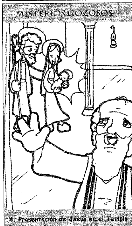
4. Presentación de Jesús en el Templo

DIOS TE SALVE, MARÍA, LLENA ERES DE GRACIA, EL SEÑOR ES CONTIGO, BENDITA TÚ ERES ENTRE TODAS LAS MUJERES Y BENDITO ES EL FRUTO DE TU VIENTRE, JESÚS. SANTA MARÍA, MADRE DE DIOS, RUEGA POR NOSOTROS, PECADORES, AHORA Y EN LA HORA DE NUESTRA MUERTE, AMÉN.