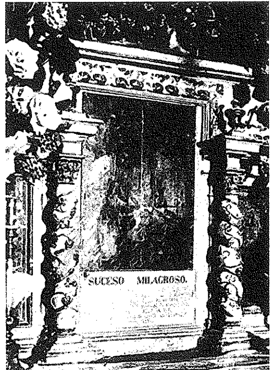
Única fotografía conocida del Sagrari del Miracle

TABERNÁCULO o SAGRARIO de la Iglesia de Alboraya de donde fue extraído el sagrado Viático que había de administrarse a un morisco converso del pueblo de Almáspera, artísticamente cincelado, puramente gótico, adornado con esmaltes de sugestiva tonalidad, por su valor intrínseco, por lo egregio de su origen, por su importancia histórica, por su remota antigüedad, constituye una pujante manifestación de arte retrospectivo y es, indudablemente, una de las piezas capitales de cuantas integran el tesoro de la Iglesia Parroquial de Alboraya. Aparte del Sagrario, de la Arquilla y del Cáliz, cuya somera descripción acabamos de hacer, en otros lugares de la Iglesia, en las calles, en las plazas, en las blancas alquerías, en las poéticas barracas que pueblan los campos de Alboraya, pinturas al óleo, artísticos bajorrelieves, valiosísimos retablos de azulejos, que iluminan en todos los casos viejas lámparas votivas, evocan ante el emocionado viajero el "Milagro dels Peixtes" que mantiene despierta la fe de un pueblo (Blanco y Negro -ABC- Madrid. 10.06.36)